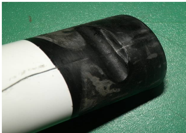
Otlačenie skrutky jadra vrtule do krčku listu vrtule.

Navrhujem vykonať dôslednú montáž vrtule s dôrazom na ťahovací moment matíc podľa doporučeného ťahovacieho momentu výrobcom. Skontrolovať, či je dostatočná vôľa medzi jadrami vrtule.